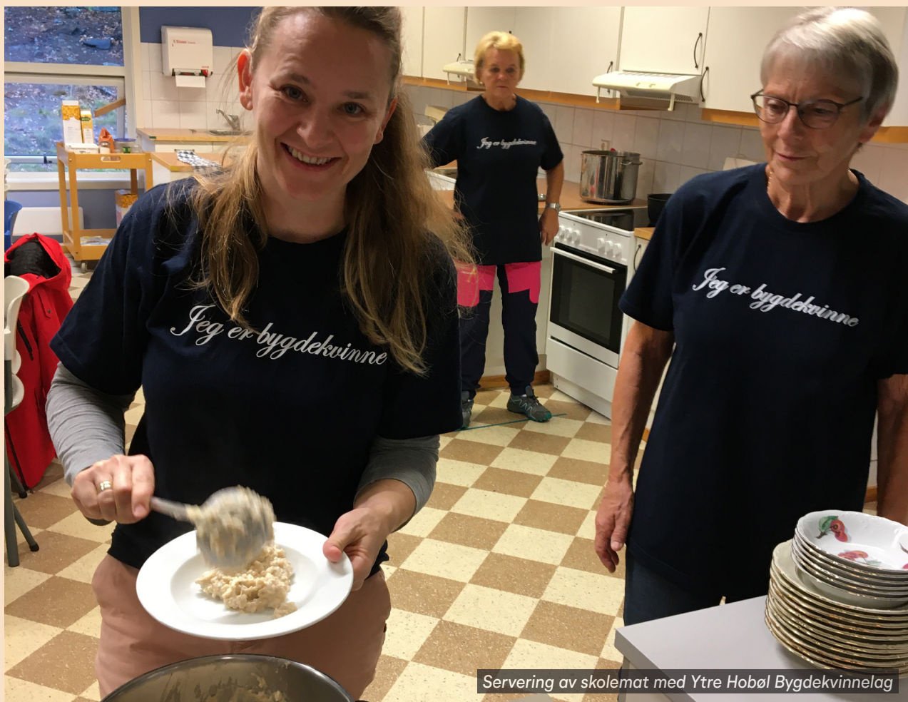
Servering av skolemat med Ytre Hobøl Bygdekvinnelag

8. Måltidet må ha en god sosial ramme som fremmer et godt skolemiljø. Skolemåltidet er mer enn et måltid og gir gode muligheter for å jobbe for et inkluderende skolemiljø.