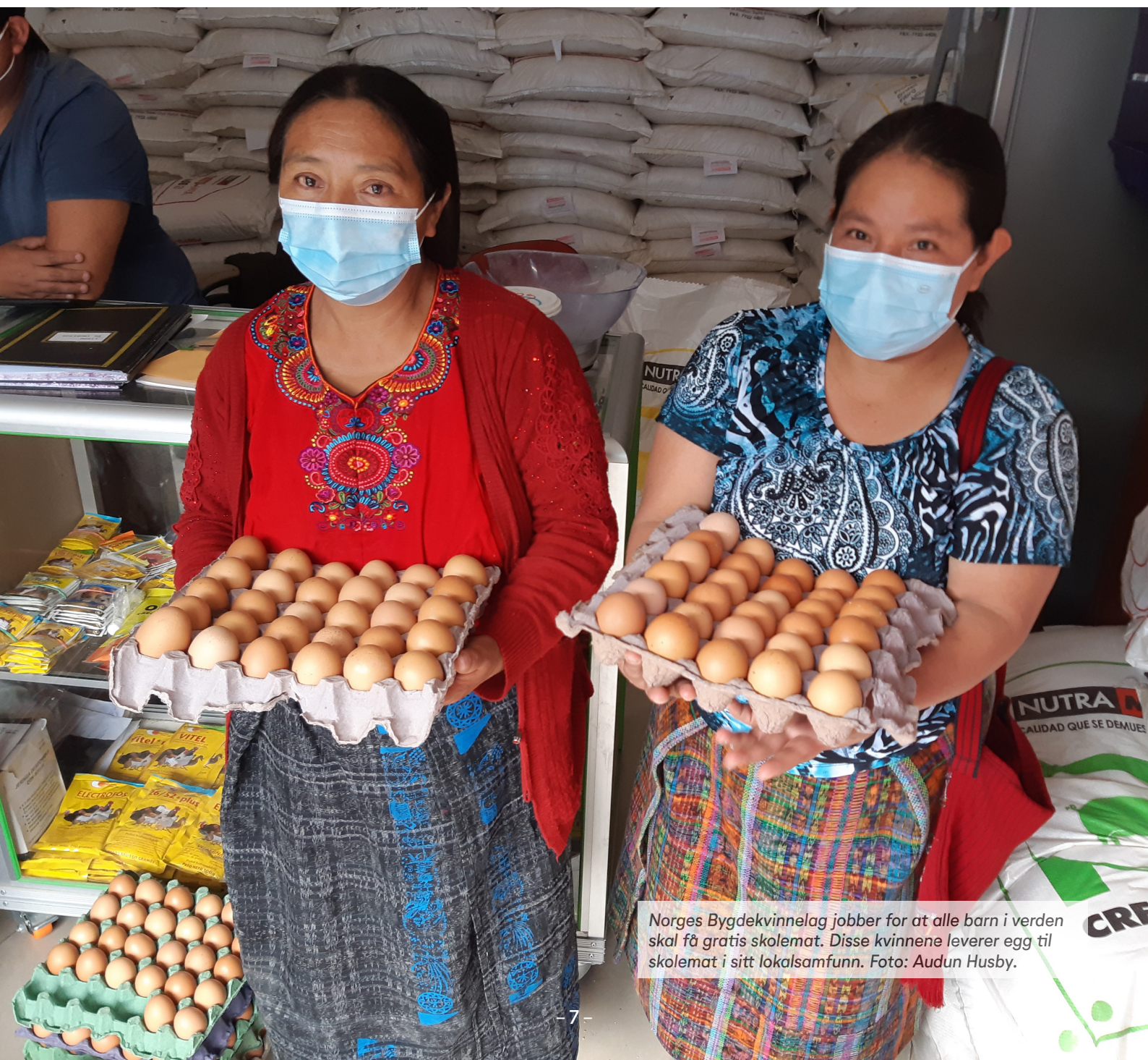
Norges Bygdekvinnelag jobber for at alle barn i verden skal få gratis skolemat. Disse kvinnene leverer egg til skolemat i sitt lokalsamfunn.

For Norges Bygdekvinnelag er det viktig at norske myndigheter følger opp denne tilrådingen internasjonalt og nasjonalt, og at de ser sammenhengen mellom FN-organisasjonenes råd og innføring av et skolemåltid i Norge.