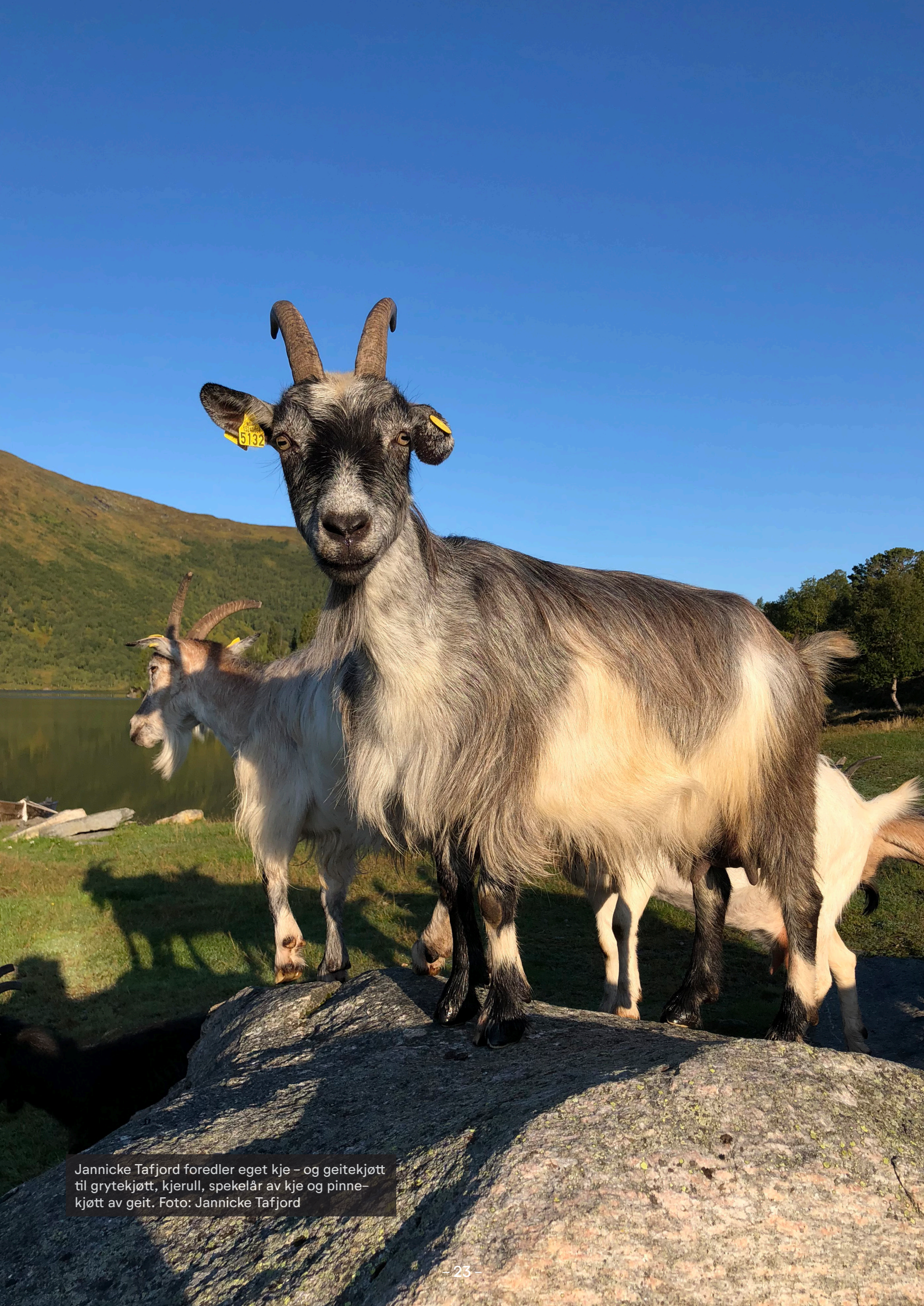
Jannicke Tafjord foredler eget kje – og geitekjøtt til grytekjøtt, kjerull, spekelår av kje og pinnekjøtt av geit.