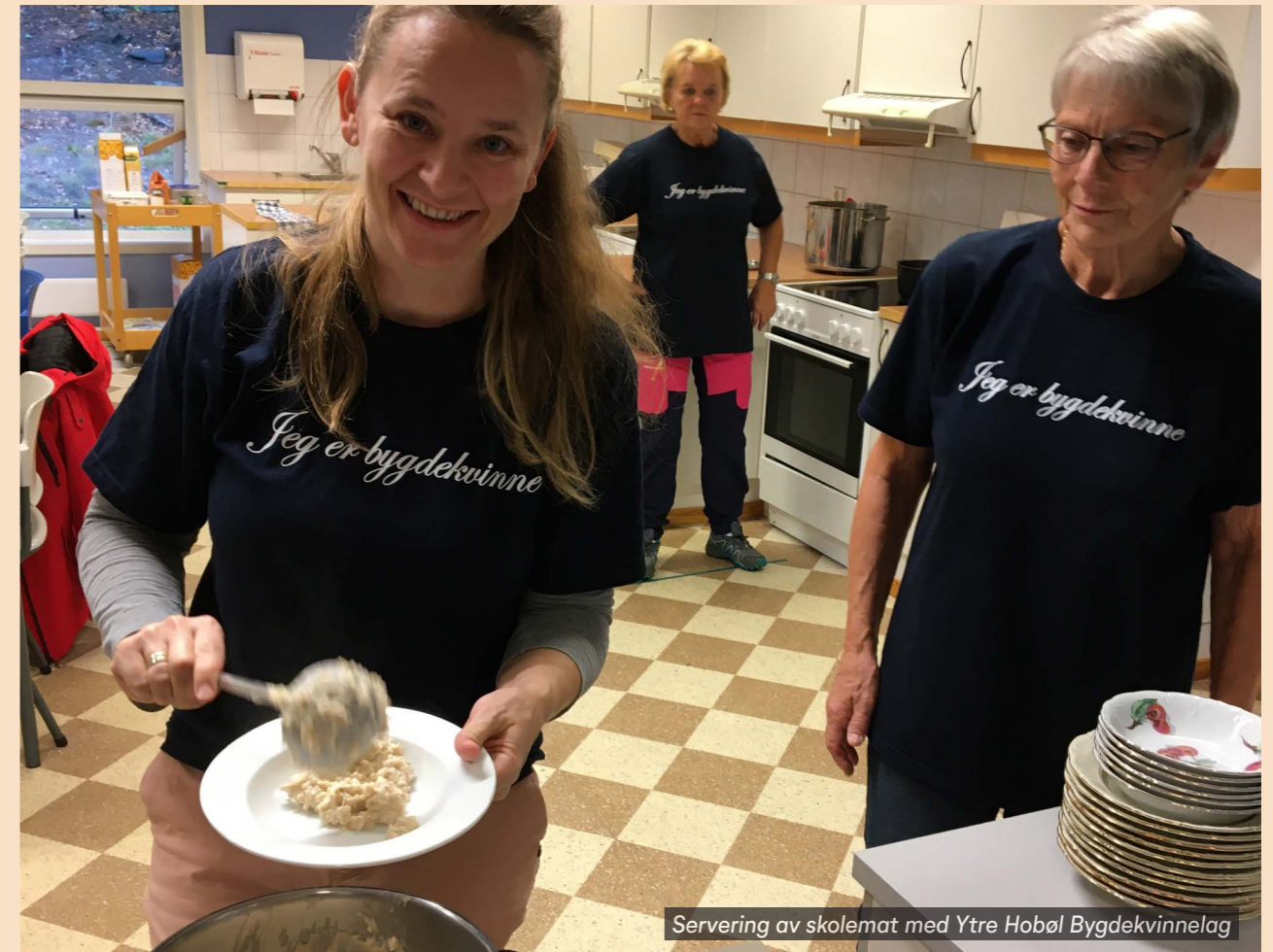
Servering av skolemat med Ytre Hobøl Bygdekvinne lag

8. Måltidet må ha en god sosial ramme som fremmer et godt skolemiljø. Skolemåltidet er mer enn et måltid og gir gode muligheter for å jobbe for et inkluderende skolemiljø.