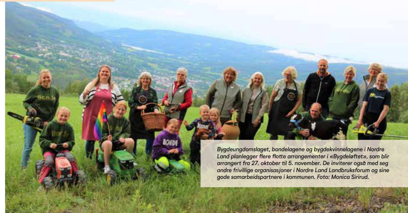
Bygdeungdomslaget, bondelagene og bygdekvinnelagene i Nordre Land planlegger flere flotte arrangementer i «Bygdeløftet», som blir arrangert fra 27. oktober til 5. november. De inviterer også med seg andre frivillige organisasjoner i Nordre Land Landbruksforum og sine gode samarbeidspartnere i kommunen.