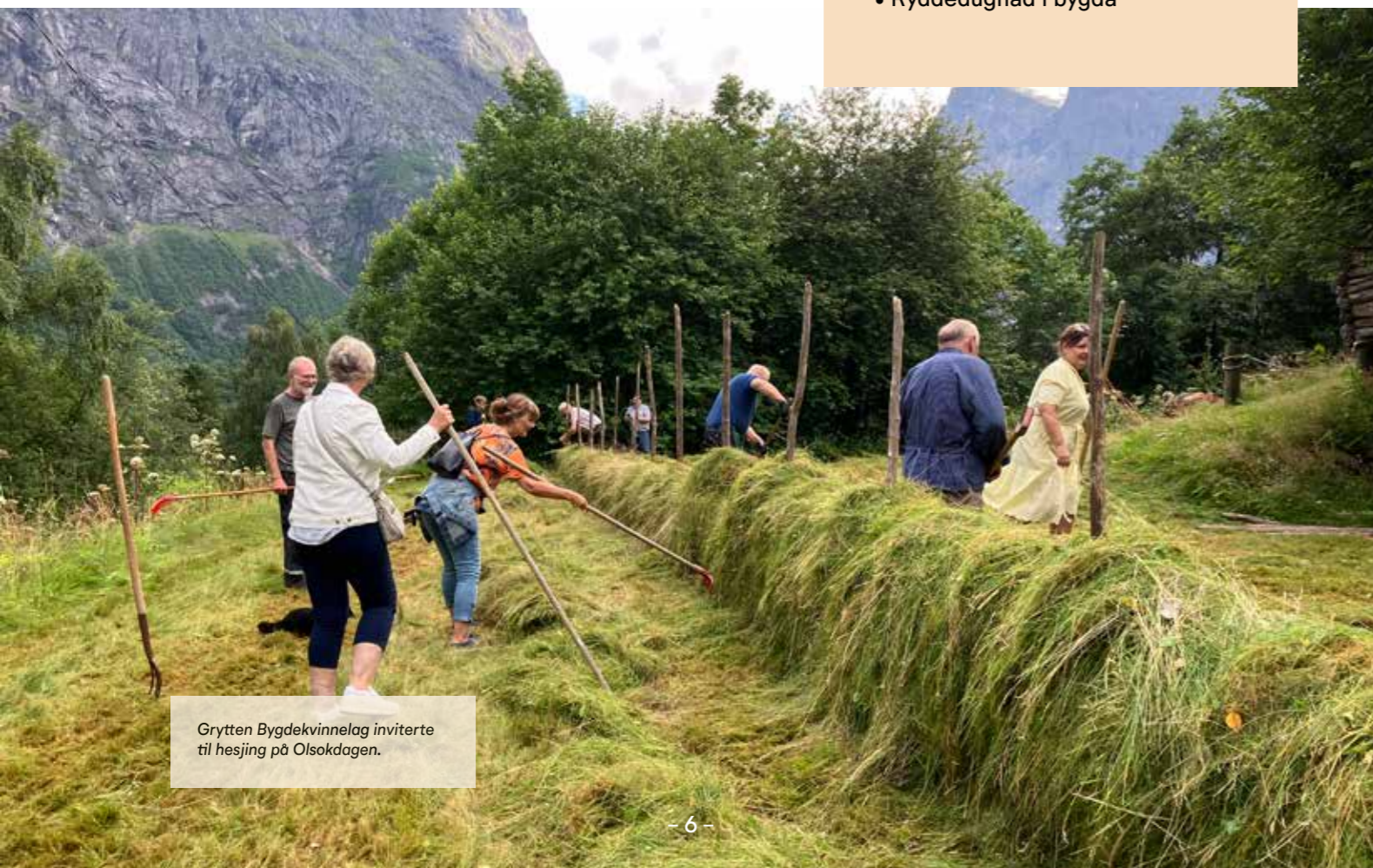
Grytten Bygdekvinne­lag inviterte til hesjing på Olsokdagen.

Morgen etter aksjonsnatta kan dere invitere bygda til bålfrokost og kaffe. Få også med de nyvalgte lokalpolitikere. Her kan de både få en sjanse til å vise seg fram, og vi kan få en mulighet til å formidle forventninger til deres arbeid de neste fire årene. Kanskje er det problemer som må fikses, og kanskje gjør de noe bra som de må gjøre mer av.