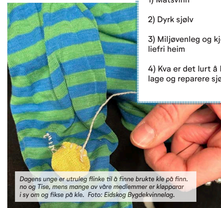
Dagens unge er utruleg flinke til å finne brukte kle på finn.no og Tise, mens mange av våre medlemmer er kløpparar i sy om og fikse på kle.