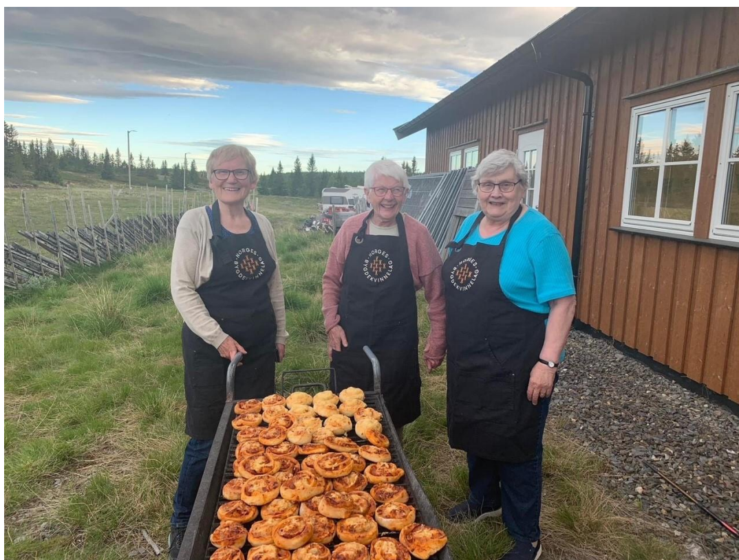
Sør-Fron Bygdekvinnelag i Oppland mettet en hel 4H leir på Gåla med Pizzasnurrer.