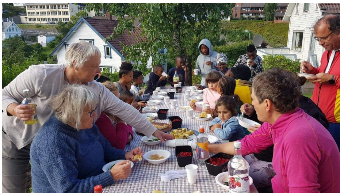
Mens Sand Bygdekvinne­lag i Rogaland venter på at tomatene skal modnes og potetene kan tas opp, koser de seg med vafler og syltetøy av Aronia fra hekken. Sukkererter og grønnkål blir fordelt mellom deltakerne.