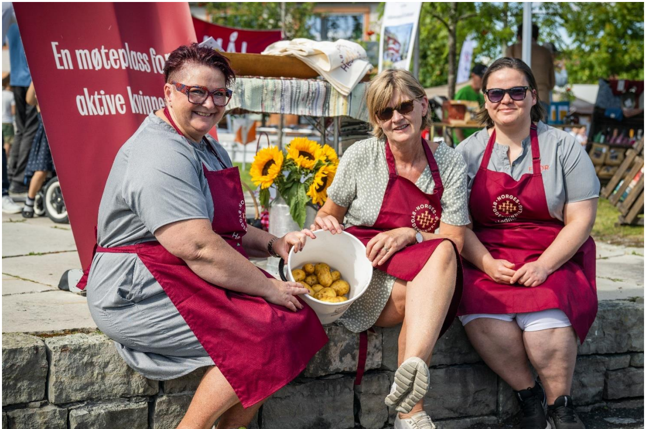
Hedmark Bygdekvinnelag arrangerer NM i potetskrelling 17. september i Vikingskipet på Hamar.