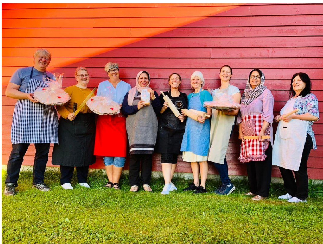
Nittedal og Hakada Bygdekvinne­lag i Akershus med prosjektet «Krydder i hverdagen» lager flatbrød for å selge på stand på Nittedal matfestival. Oppskriften er hentet på tradisjonsmat.no og tilsettes ulike krydder.