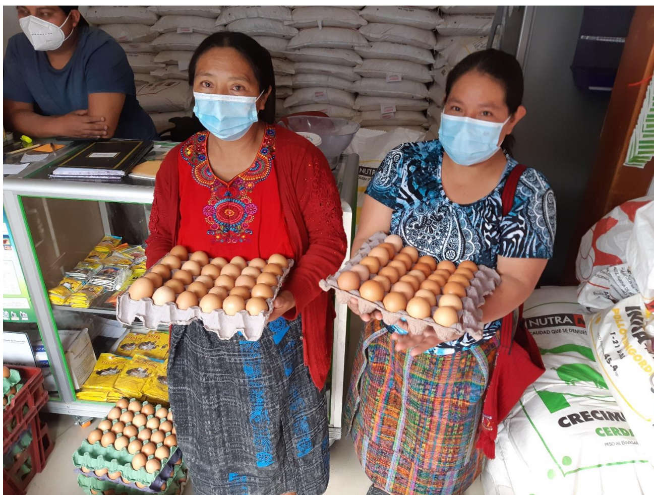
Kvinnelige bønder i Guatemala produserer og selger egg til den lokale skolematordningen.

Likestilling og styrking av kvinners rettigheter er svært viktig for å hindre matkriser og fattigdom. Når kvinner får tilgang og kontroll over ressurser på lik linje som menn, viser erfaring at det får store effekter på den økonomiske veksten i utviklingsland. (Utviklingsfondet).