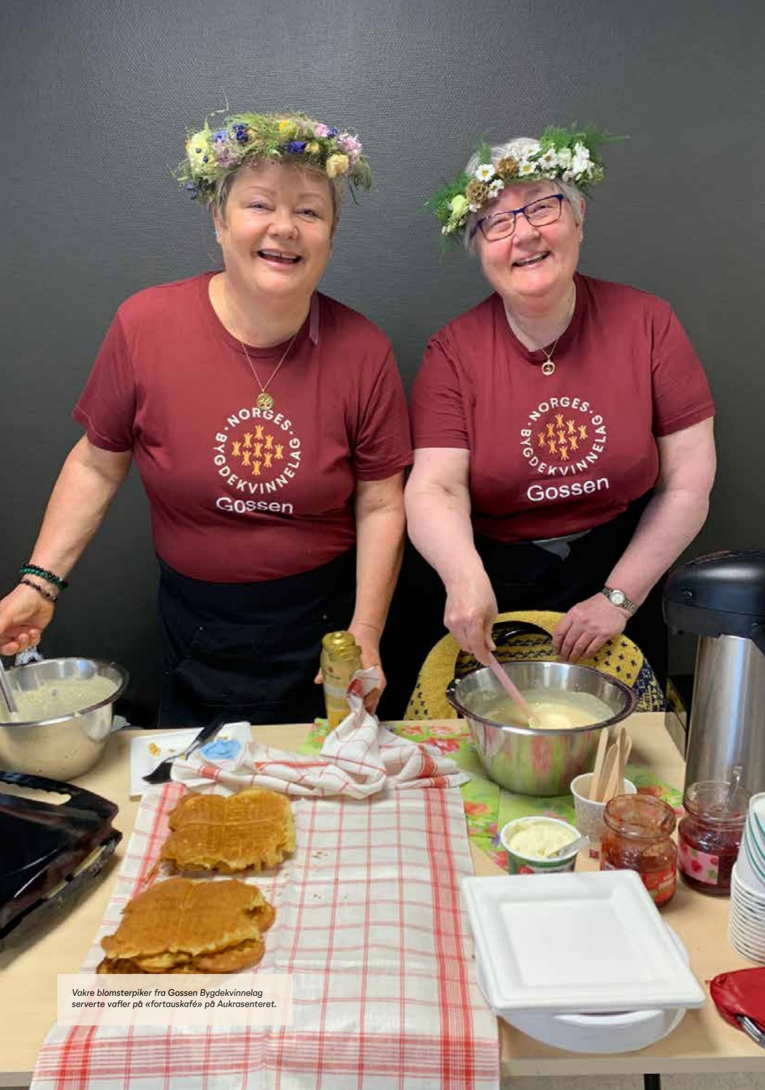
Vakre blomsterpiker fra Gossen Bygdekvinnelag serverte vaffer på «fortauskafé» på Aukrasenteret.