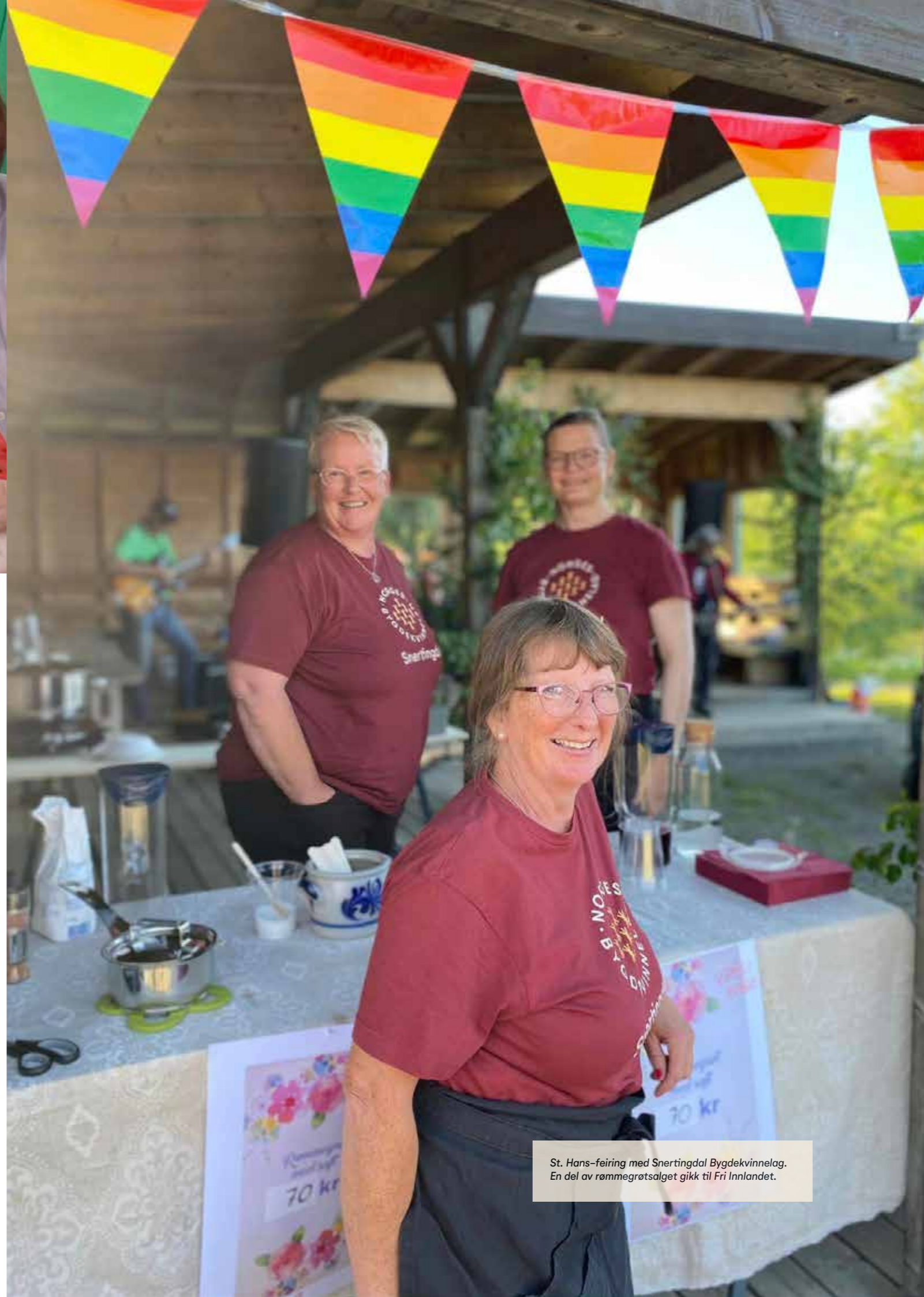
St. Hans-feiring med Snertingdal Bygdekvinne- og Utviklingsfondet. En del av rømmegrøtsalget gikk til Fri Innlandet.