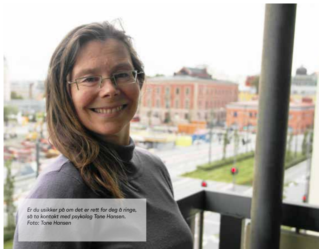
Er du usikker på om det er rett for deg å ringe, så ta kontakt med psykolog Tone Hansen.

Om du vil ha en samtale kan du ringe til Tone på onsdager mellom klokken 18.00 og 20.00 for å avtale tidspunkt for din samtale. Telefon 475 15 940.