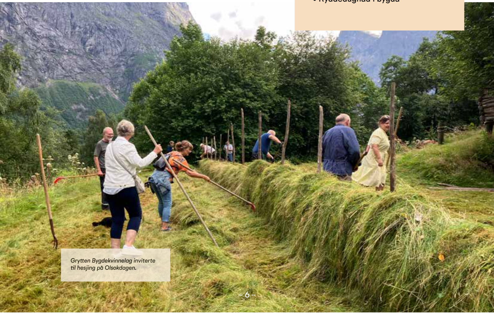
Grytten Bygdekvinne­lag inviterte til hesjing på Olsokdagen.

Morgen etter aksjonsnatta kan dere invitere bygda til bålfrokost og kaffe. Få også med de nyvalgte lokalpolitikere. Her kan de både få en sjanse til å vise seg fram, og vi kan få en mulighet til å formidle forventninger til deres arbeid de neste fire årene. Kanskje er det problemer som må fikses, og kanskje gjør de noe bra som de må gjøre mer av.