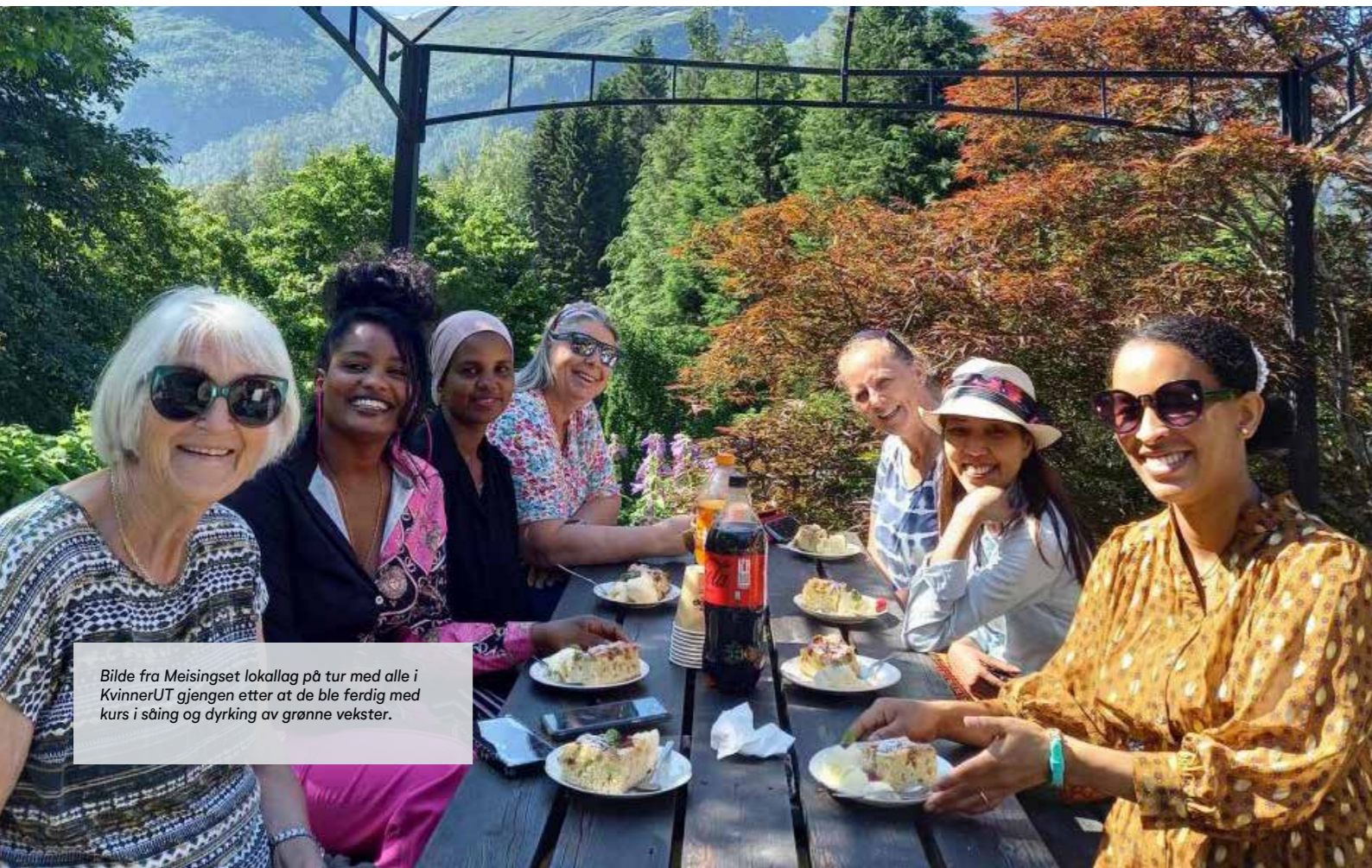
Bilde fra Meisingset lokallag på tur med alle i KvinnerUT gjengen etter at de ble ferdig med kurs i såing og dyrking av grønne vekster.