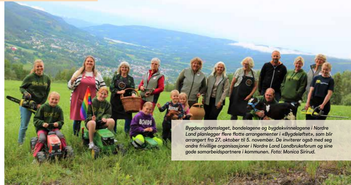
Bygdeungdomslaget, bondelagene og bygdekvinne­lagene i Nordre Land planlegger flere flotte arrangementer i «Bygdeløftet», som blir arrangert fra 27. oktober til 5. november. De inviterer også med seg andre frivillige organisasjoner i Nordre Land Landbruksforum og sine gode samarbeidspartnere i kommunen.