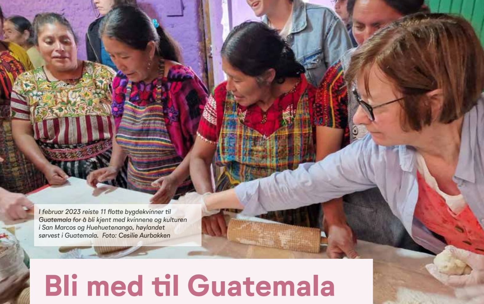
I februar 2023 reiste 11 flotte bygdekvinne til Guatemala for å bli kjent med kvinnene og kulturen i San Marcos og Huehuetenango, høylandet sørvest i Guatemala.